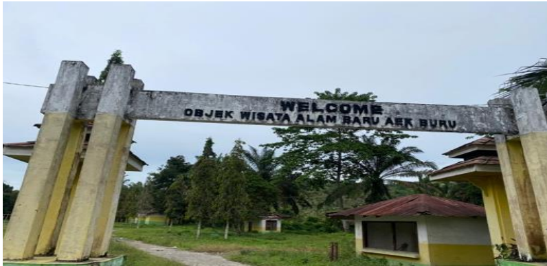
Gambar1. Foto Dokumentasi Objek Wisata di Desa Batu Tunggal (10 Oktober 2022)