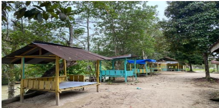
Gambar 3. Foto Dokumentasi Tempat Istirahat Pengunjung Wisata (14 Desember 2022)