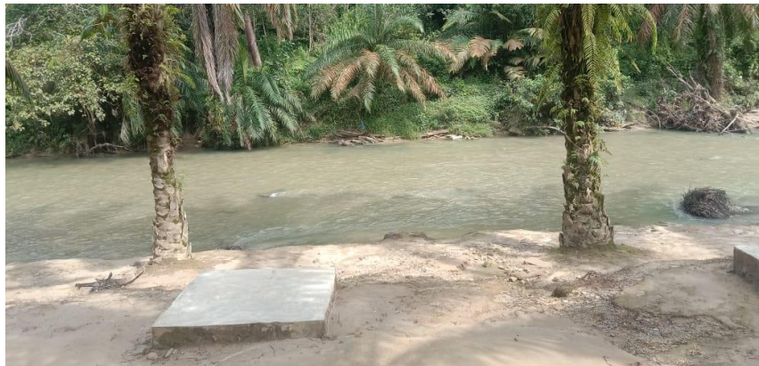
Gambar 2. Foto Dokumentasi Objek Wisata Fokus Penelitian (19 Oktober 2022)