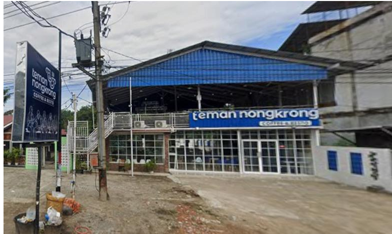
Gambar 1. 1. Lokasi Penelitian Café Teman Nongkrong

Lokasi penelitian ini dilakukan di Cafe Teman Nongkrong yang merupakan salah satu tempat usaha di bidang kuliner yang menyediakan berbagai menu makanan dan minuman bagi pelanggan. Pemilihan lokasi penelitian ini didasarkan pada tingginya jumlah pengunjung serta beragamnya karakteristik pelanggan yang datang, sehingga memungkinkan diperolehnya data yang representatif untuk dianalisis. Cafe ini menjadi tempat yang strategis untuk meneliti tingkat kepuasan pelanggan karena interaksi antara kualitas produk dan pelayanan terjadi secara langsung. Selain itu, Cafe Teman Nongkrong juga memiliki sistem pelayanan yang melibatkan beberapa aspek penting seperti rasa makanan, harga menu, keramahan pelayanan, kebersihan tempat, serta kecepatan penyajian, yang seluruhnya menjadi variabel dalam penelitian ini. Lingkungan kafe yang aktif dan dinamis memberikan gambaran nyata mengenai pengalaman pelanggan dalam menikmati layanan. Dengan demikian, lokasi penelitian ini dinilai relevan dan sesuai dengan tujuan penelitian, yaitu untuk menganalisis dan mengklasifikasikan tingkat kepuasan pelanggan berdasarkan faktor-faktor yang memengaruhinya.