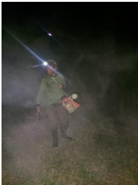
11. Pelaksanaan Aplikasi Penyemprotan Pengendalian Hama Ulat Api dengan Teknik Fogging