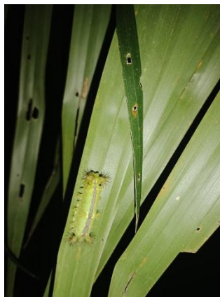
7. Hama Ulat Api yang berukuran sedang