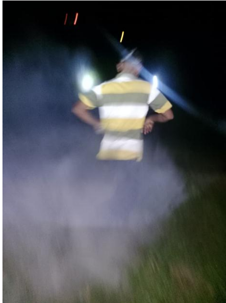
10. Pelaksanaan Aplikasi Penyemprotan Pengendalian Hama Ulat Api dengan Teknik Fogging