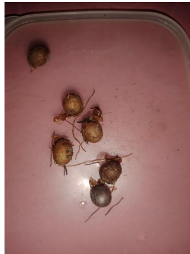
9. Pupa Kepomponng Ulat Api ( Setothosea asigna ) 37-42 Hari