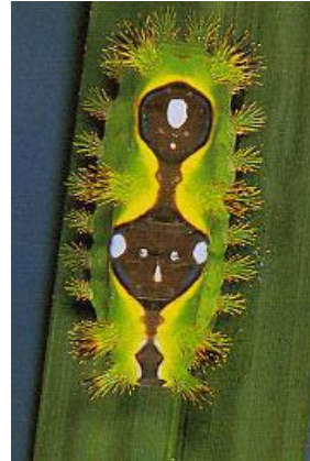
8. UDKS Ulat Api ( Setothosea asigna ) yang berukuran besar