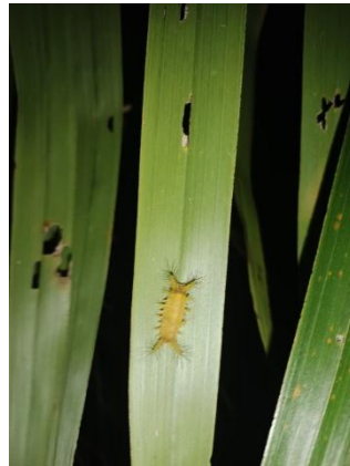
6. Hama Ulat Api yang berukuran kecil