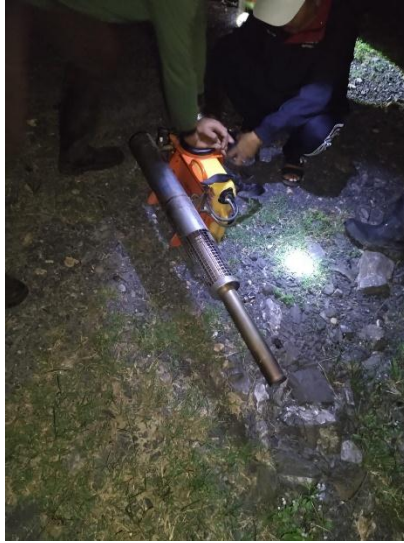
5. Alat Fogging Untuk Penyemprotan Hama Ulat Api