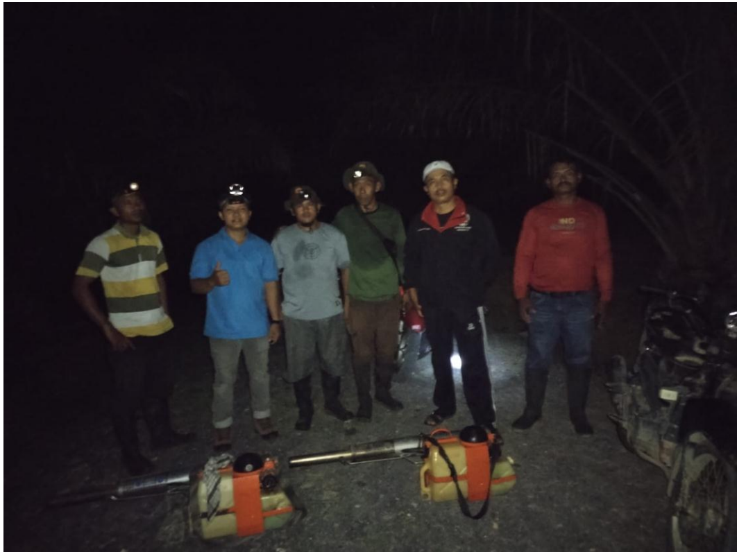
12. Gambar Pelaksanaan Setelah Proses Aplikasi Pengendalian Hama Ulat Api dengan Teknik Fogging