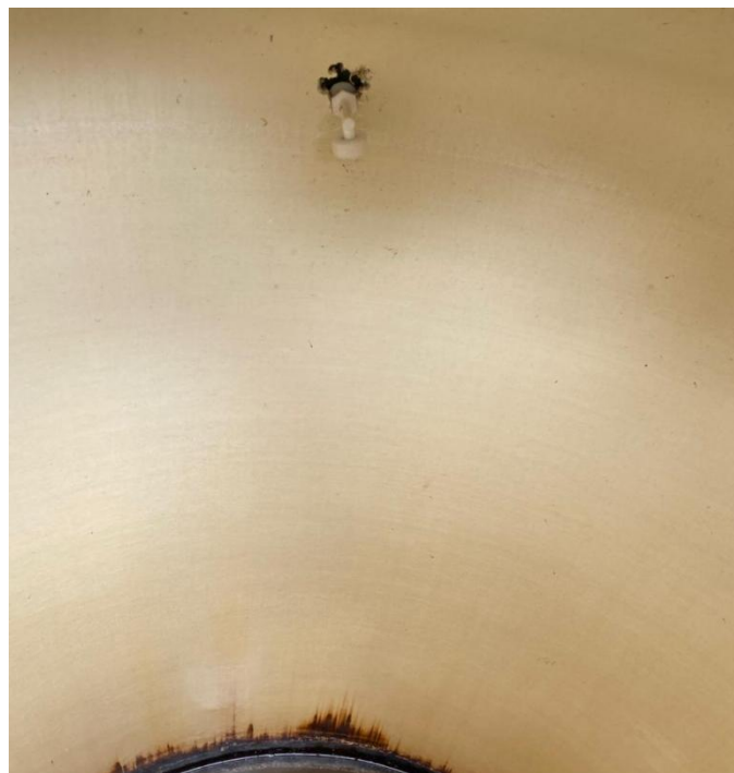
Gambar 4. 2 Pemasangan Float switch pada Tandon Air

Pada tahap ini dilakukan pemasangan sensor Float switch sebagai komponen utama dalam sistem otomatisasi pengisian air. Float switch dipasang pada bagian atas tandon air dan berfungsi sebagai pendeteksi batas maksimum ketinggian air. Pemasangan sensor ini sangat penting karena menjadi indikator utama untuk menghentikan kerja pompa secara otomatis ketika air telah penuh.