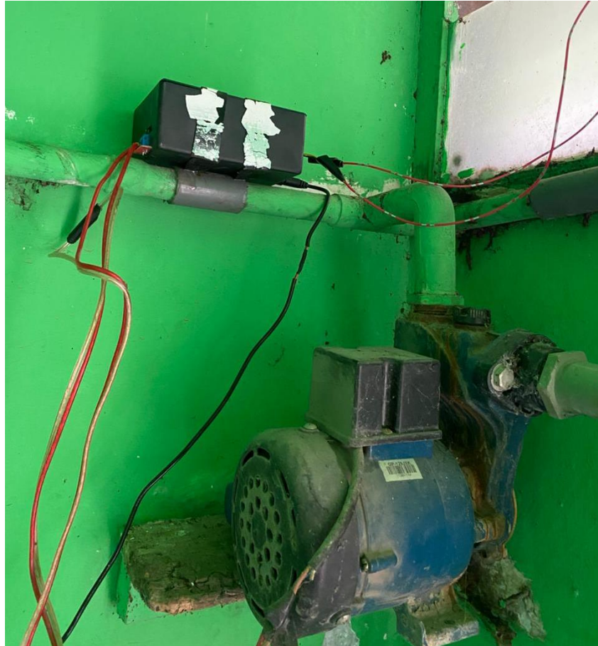
Gambar 4. 8 Implementasi Alat

dengan tujuan untuk memastikan sistem mampu bekerja secara konsisten dalam menerima perintah, mengontrol pompa air, membaca sensor Float Switch , serta mengirimkan notifikasi status.