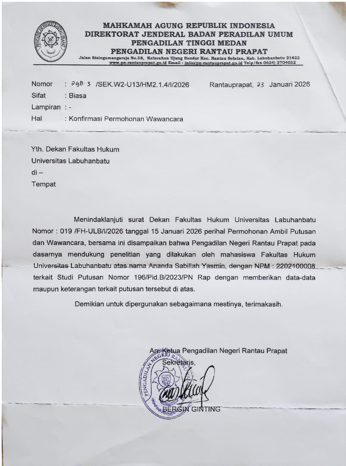
Gambar 3. Surat balasan Pengadilan Negeri Rantauprapat atas surat permohonan pengambilan draf putusan dan wawancara