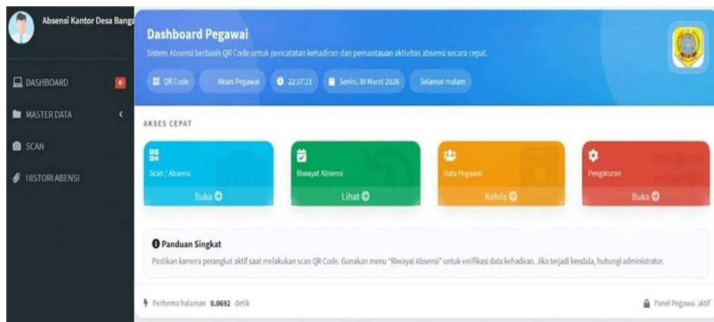
Gambar 4. 12 Halaman Pegawai