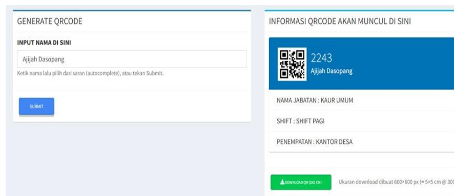
Gambar 4. 7 Generate QR Code