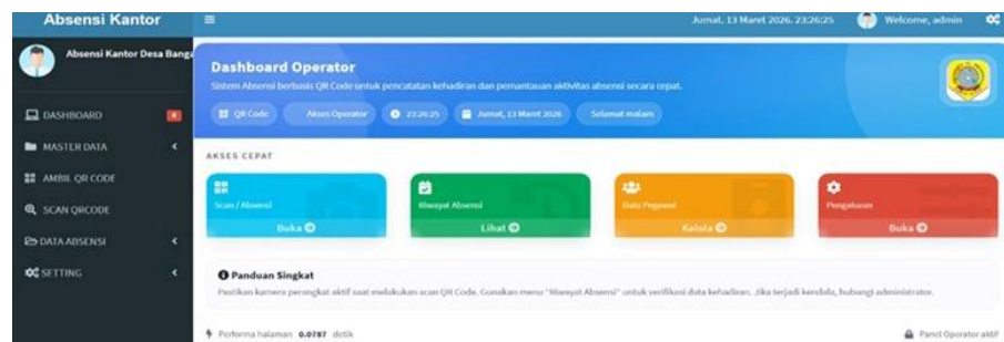
Gambar 4. 2 Halaman Dashboard