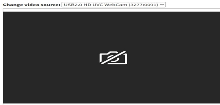
Gambar 4. 8 Scan QR Code