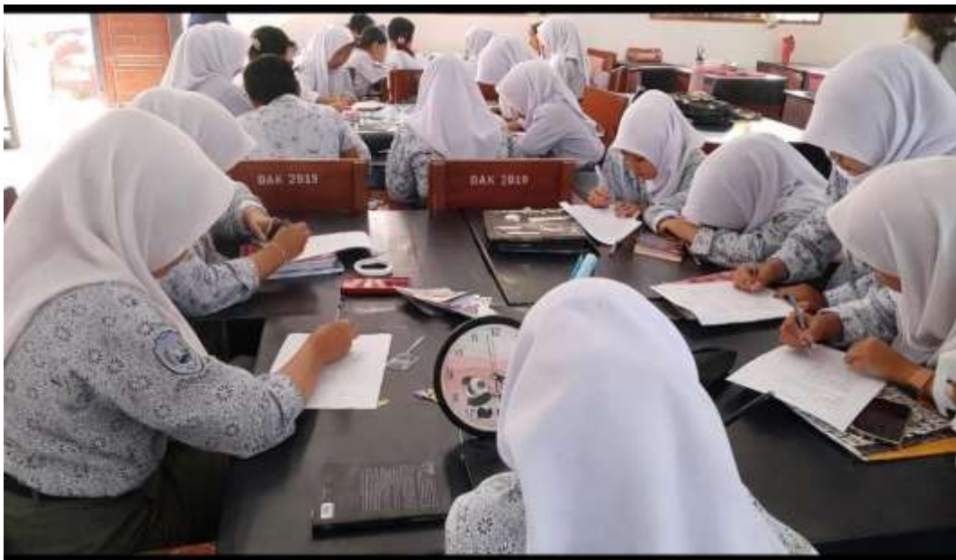
Gambar 6: Rabu 28 Februari 2026. Melaksanakan Sebar Angket Post-test Pada Siswa