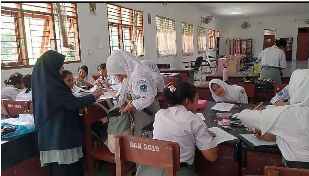
Gambar 2: Senin 26 Februari 2026. Melaksanakan Sebar Angket Pre-test Pada Siswa