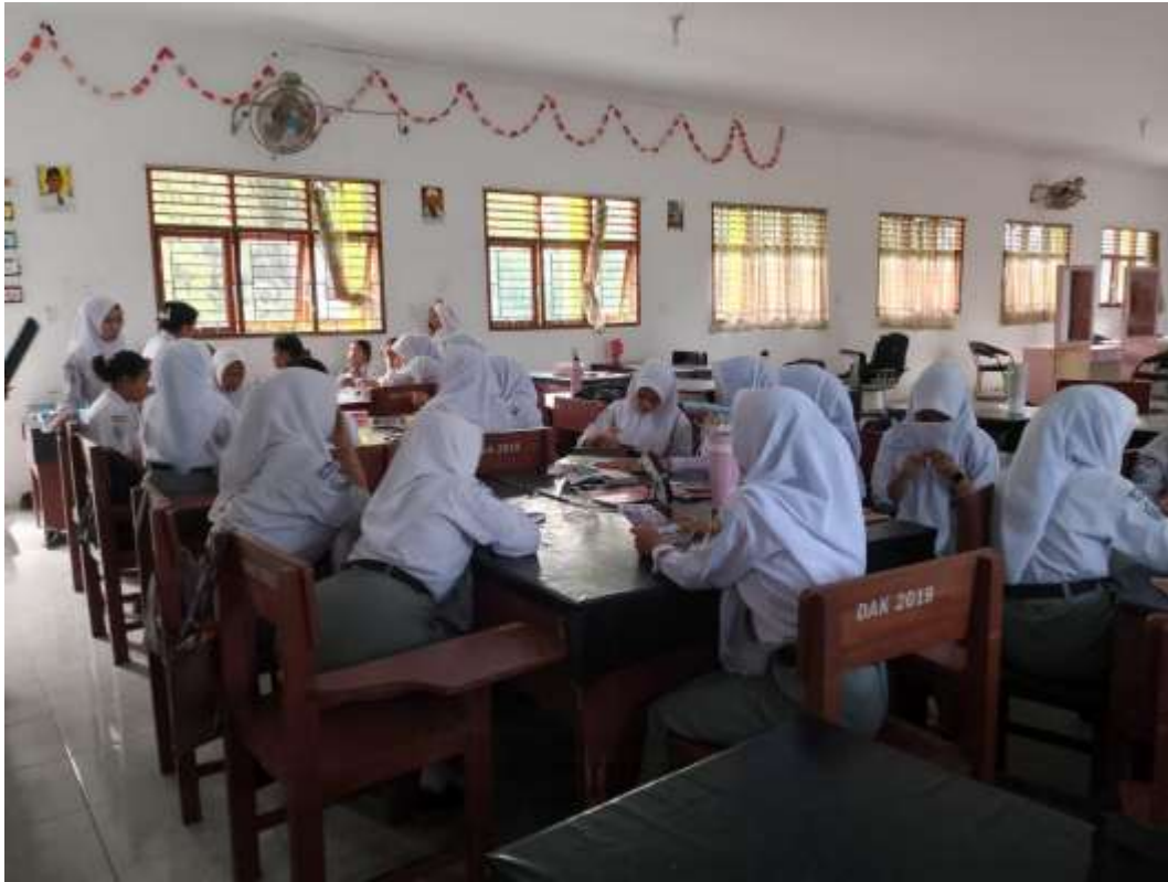
Gambar 1: Senin 26 Februari 2026. Pembelajaran PPKn Kelas XI TKR