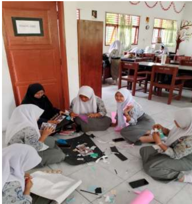
Gambar 3: Rabu 28 Februari 2026. Pembuatan Media Pop-up Book