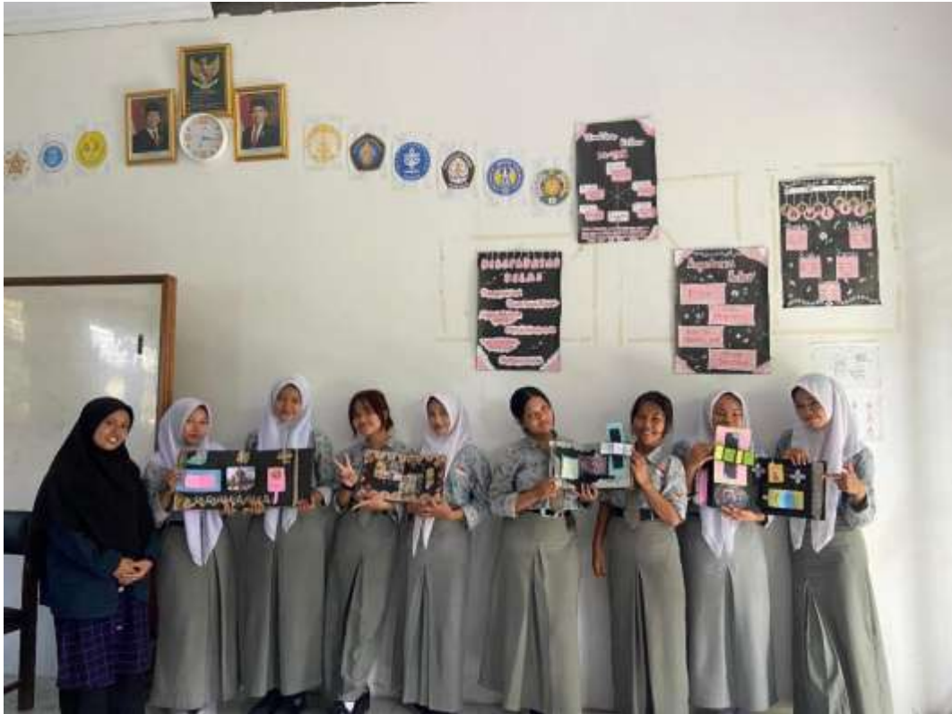
Gambar 5: Rabu 28 Februari 2026. Presentasi Media Pop-up Book Setiap Kelompok