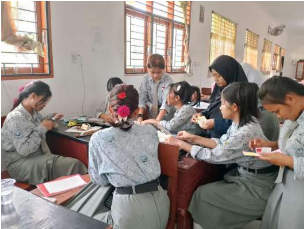
Gambar 4: Rabu 28 Februari 2026. Pembuatan Media Pop-up Book