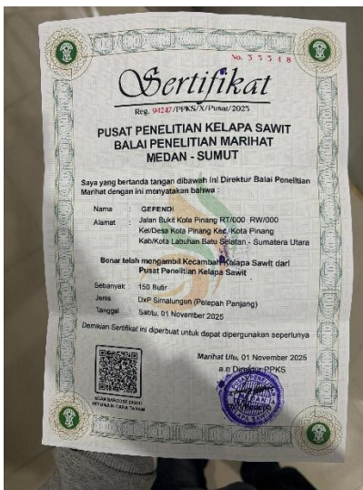
Gambar 17. Foto setrtifikat dari PPKS medan