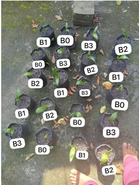
Gambar 7. Umur delapan minggu setelah tanam