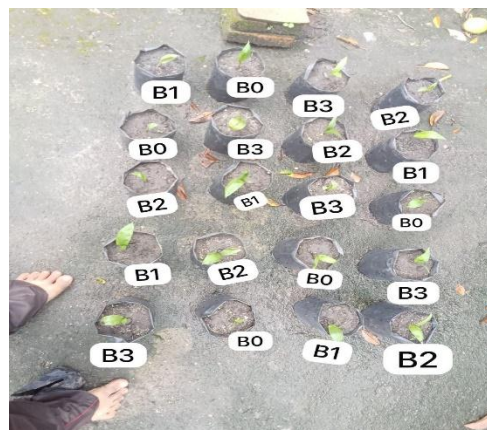
Gambar 6. Umur tujuh minggu setelah tanam