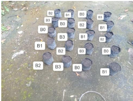
Gambar 1. Umur dua minggu setelah tanam