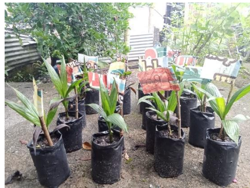
Gambar 14. Foto tanaman dari samping kiri