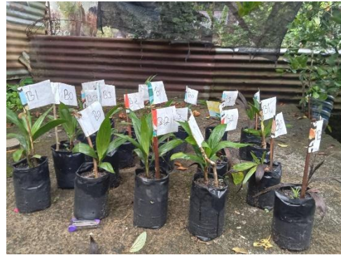
Gambar 13. Foto tanaman dari depan