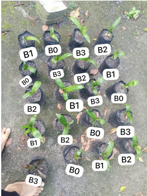
Gambar 11. Umur duabelas minggu setelah tanam