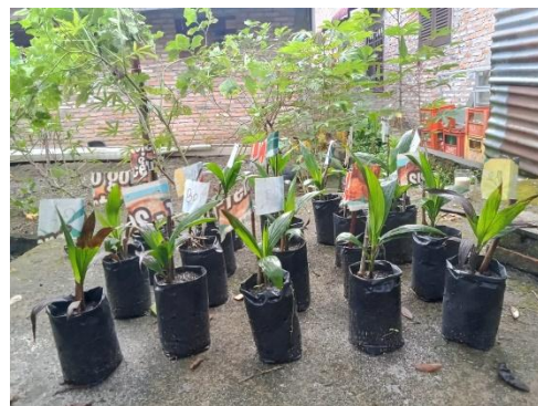
Gambar 15. Foto tanaman dari belakang