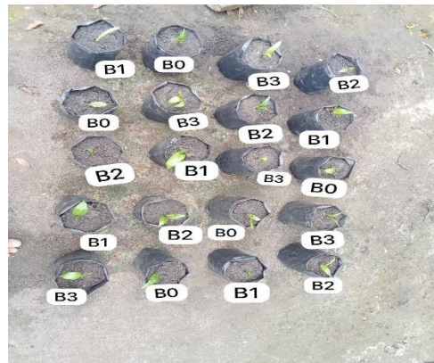
Gambar 5. Umur enam minggu setelah tanam