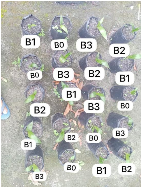
Gambar 8. Umur Sembilan minggu setelah tanam