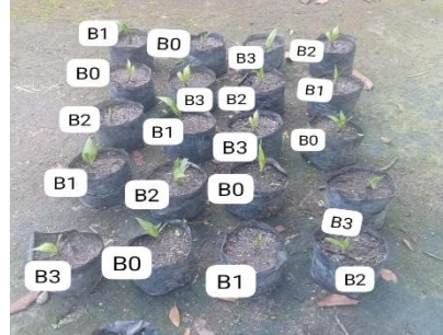
Gambar 4. Umur lima minggu setelah tanam