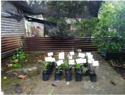
Gambar 16. Foto temoat pembibitan