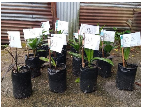
Gambar 12. Foto tanaman dari samping kanan