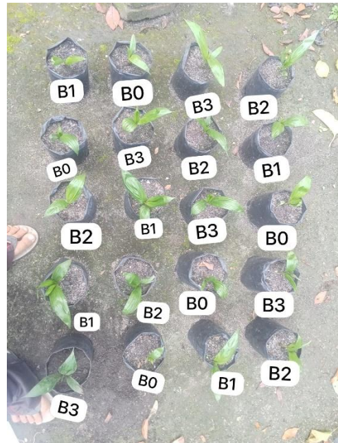
Gambar 10. Umur sebelas minggu setelah tanam