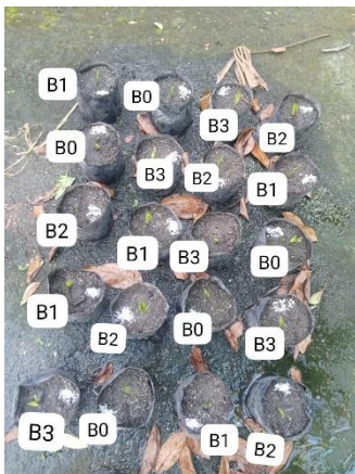
Gambar 3. Umur empat minggu setelah tanam