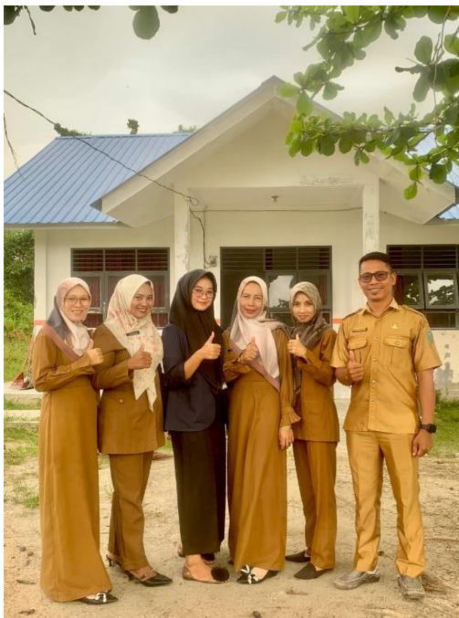
Poto Bersama Staf/Guru SMAN 1 Panai Hilir