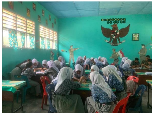
Pengujian Tes Hasil Belajar Dan Pengujian Air Oleh Siswa/Siswi SMAN 1 Panai Hilir