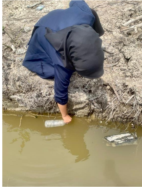
Pengambilan Sampel Air Untuk di lakukan Pengujian