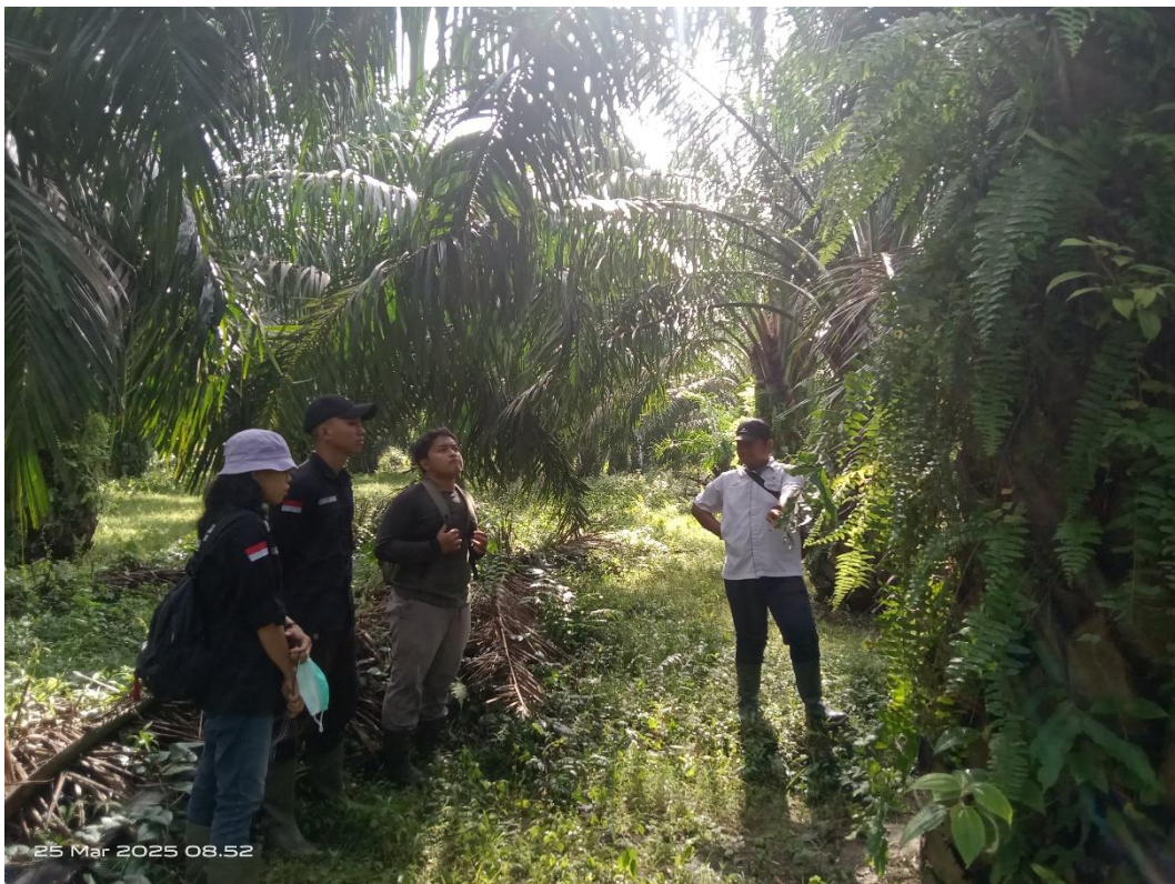
Gambar 2. Edukasi Tentang Pengaruh Serangan Hama Monyet pada Tanaman Kelapa Sawit