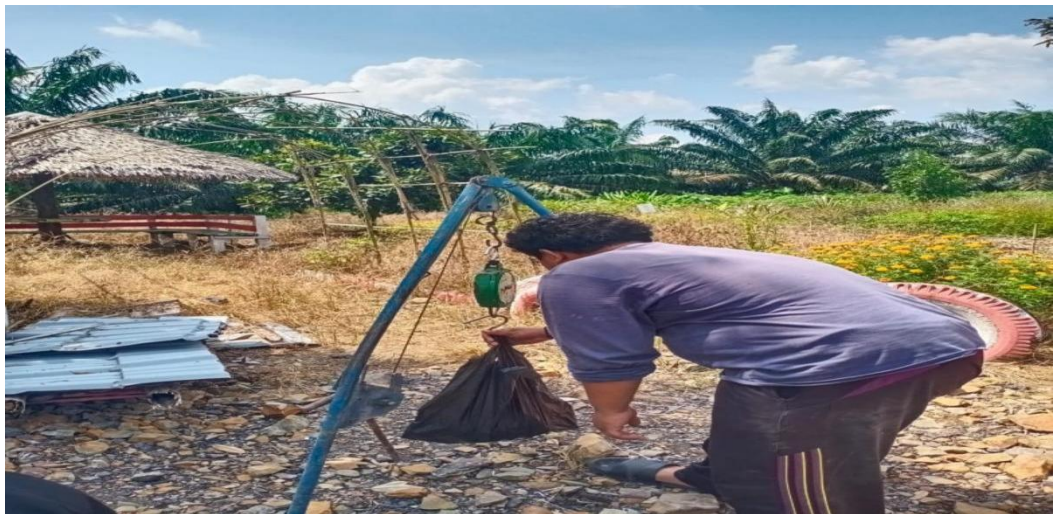
Gambar 13. Proses Penimbangan Berondolan