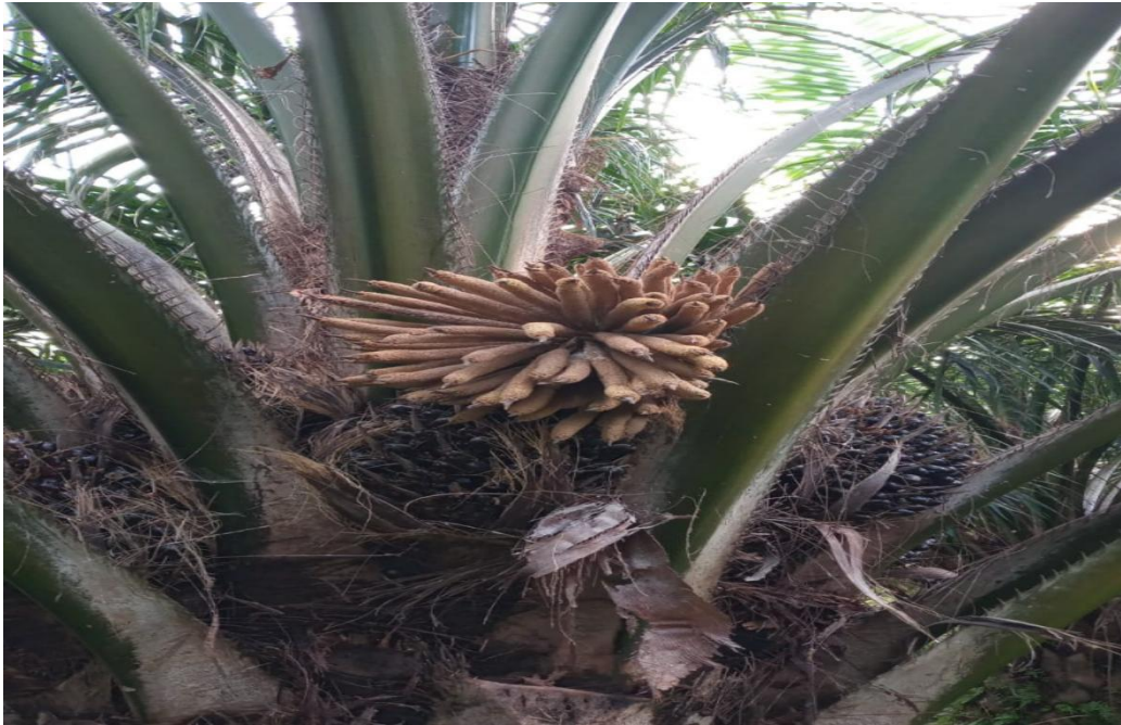
Gambar 8. Pengambilan Bunga Jantan yang Anthesis