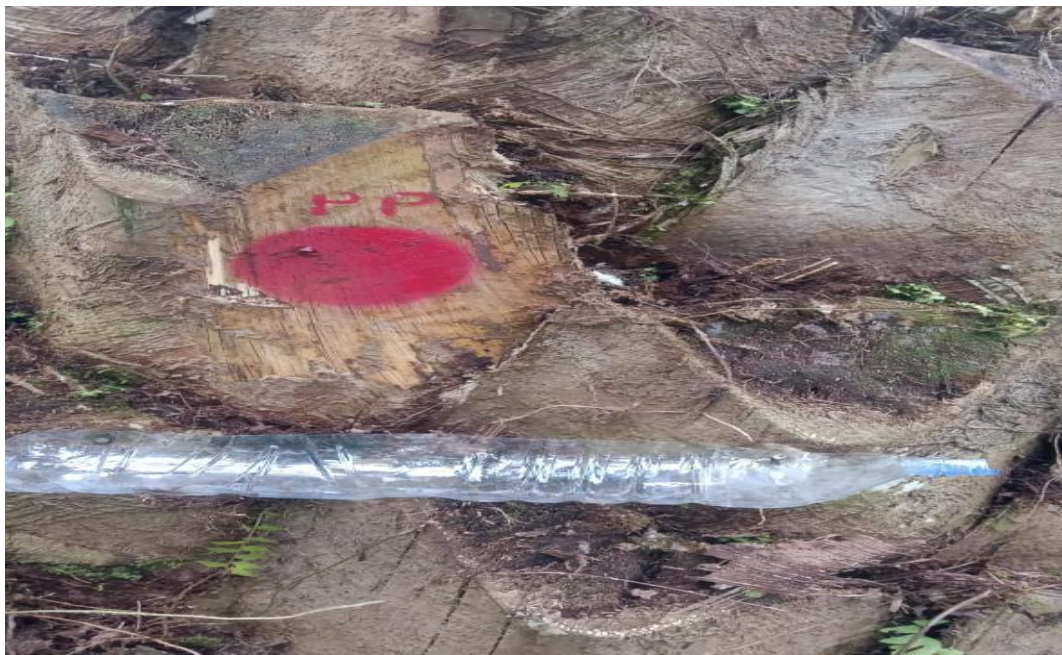
Gambar 7. Pemberian Tanda pada Hatch and Carry