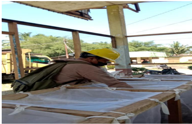
Gambar 4. Pengambilan Serangga Elaeidobius kamerunicus