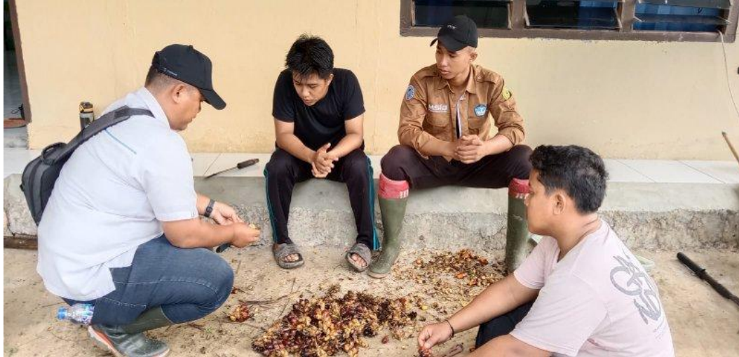
Gambar 1. Menghitung Spikelet Bersama Asisten Afdeling II