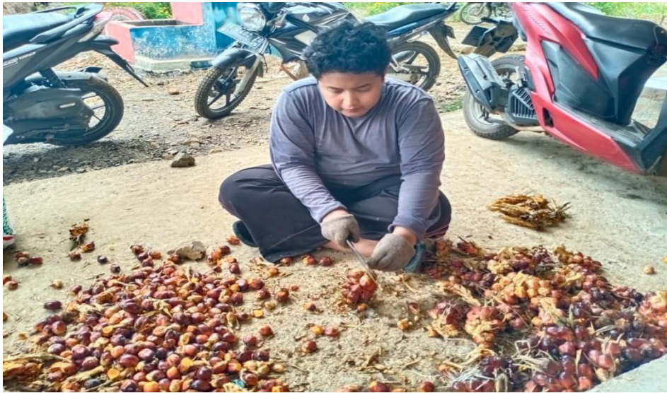
Gambar 12. Proses Memisahkan Berondolan