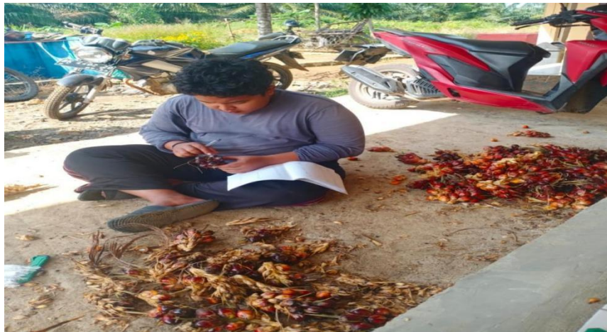
Gambar 11. Proses Menghitung Berondolan