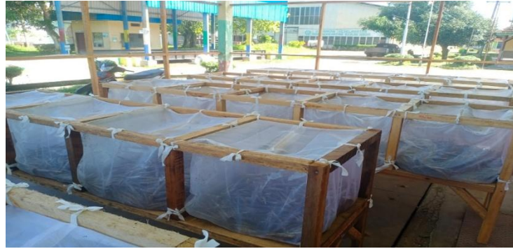
Gambar 3. Penangkaran serangga Elaeidobius kamerunicus