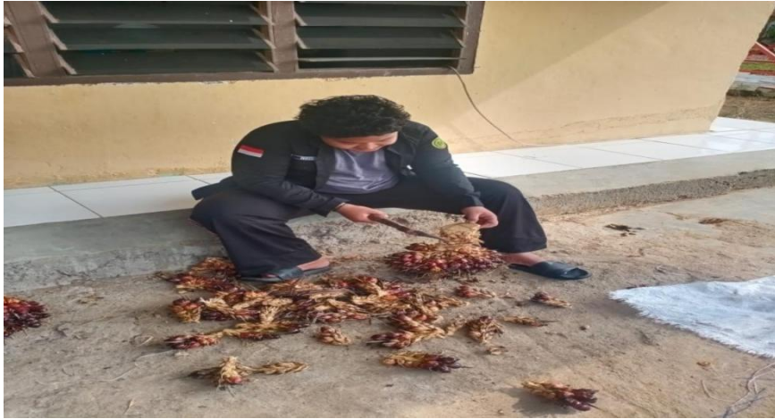
Gambar 10. Proses Menyacah Tandan Buah Segar (TBS)