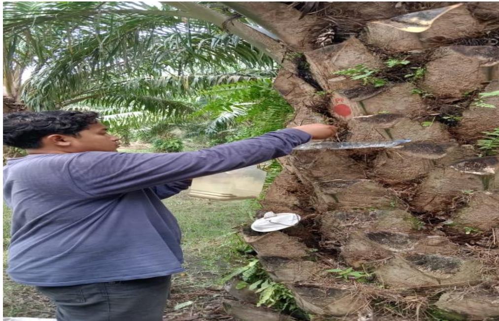
Gambar 6. Pengaplikasian Serangga Elaeidobius kamerunicus