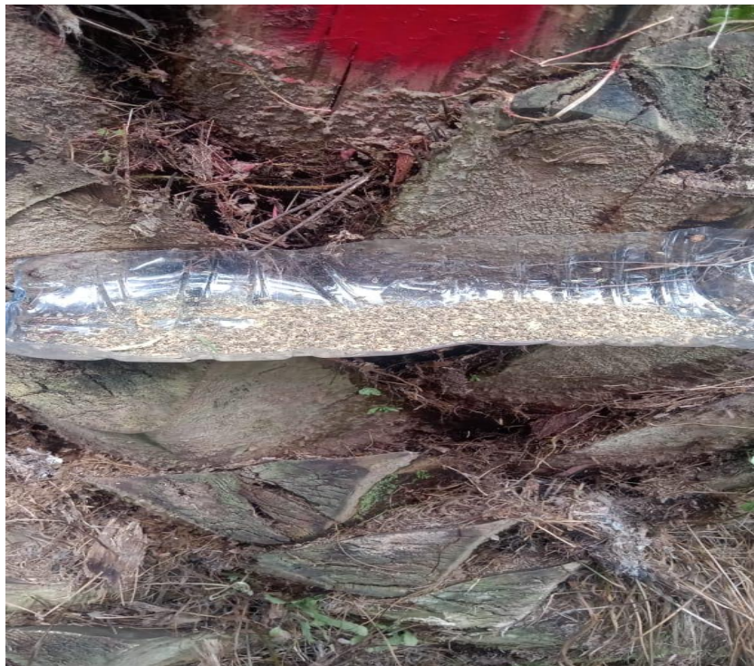
Gambar 9. Serangga Elaeidobius kamerunicus yang sudah di Aplikasi