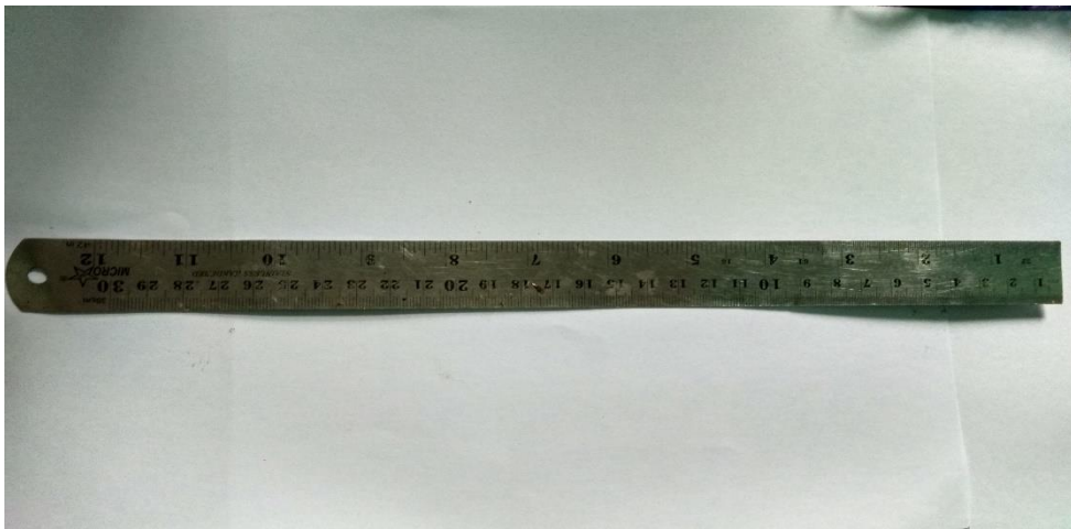
Lampiran 3. Penggaris