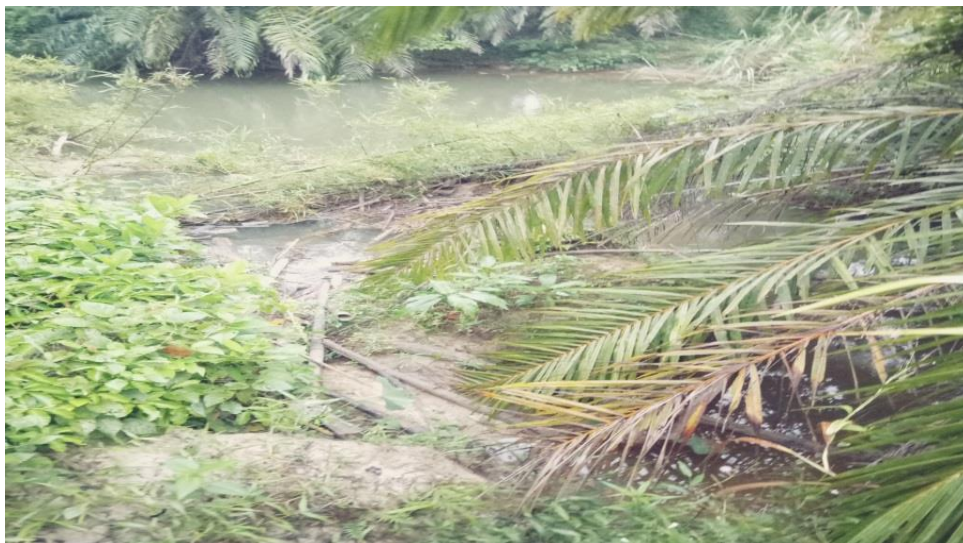
Lampiran 1. Stasiun 1