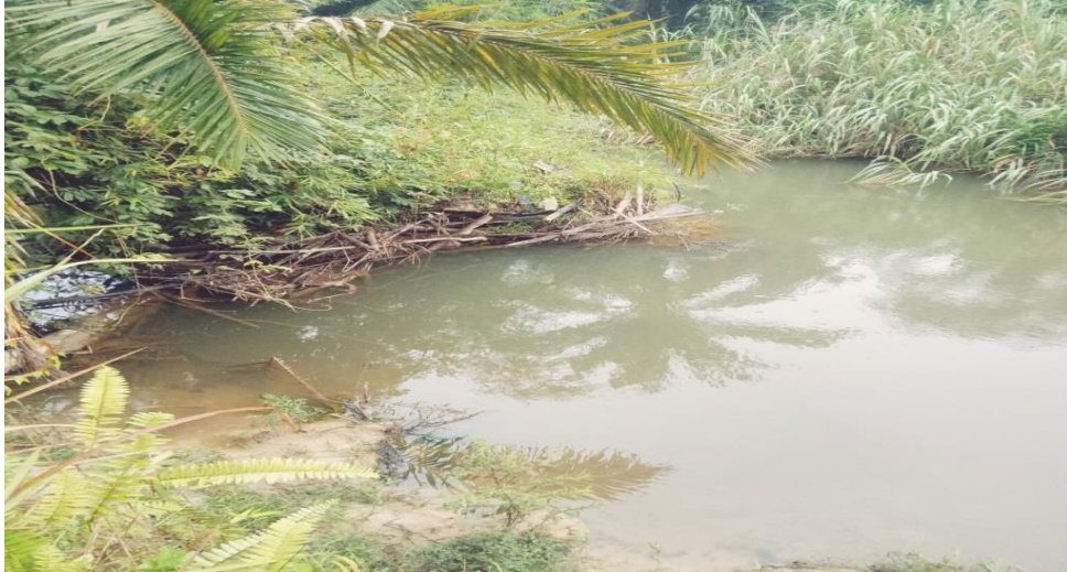
Lamiran 1. Stasiun 3