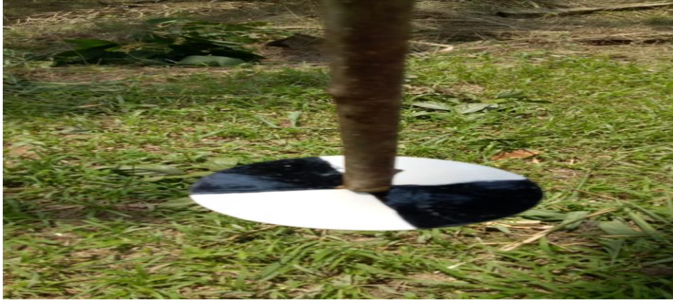
Lampiran 3. Secchi Disk . (Mengukur kecerahan air)