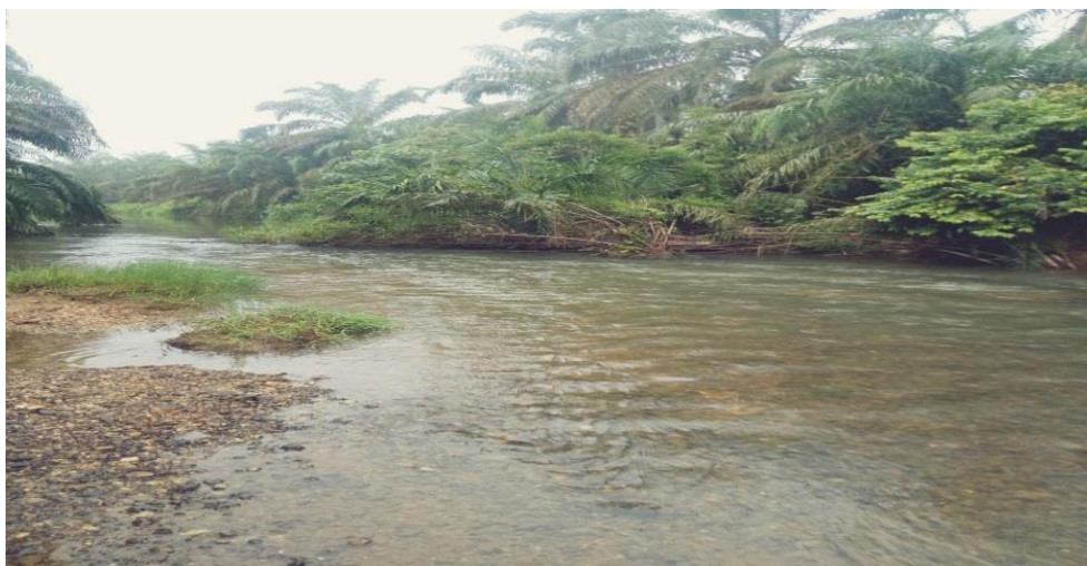
Lampiran 1. Stasiun 2