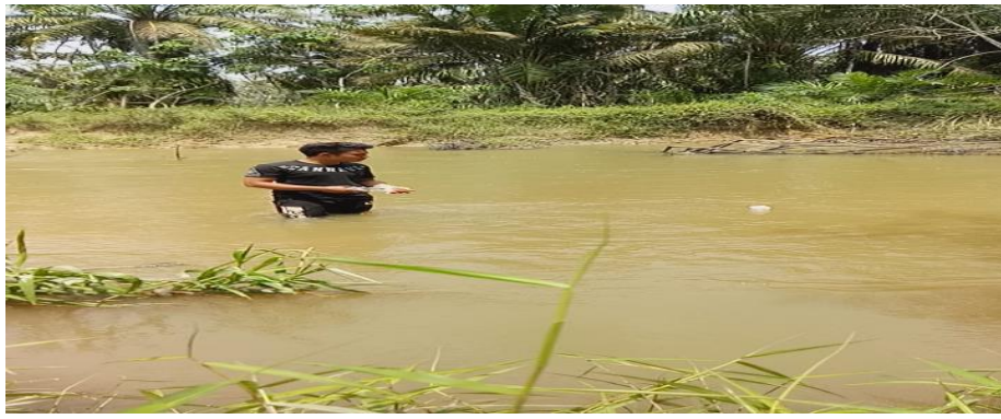
Lampiran 4. Mengukur kecepatan Arus