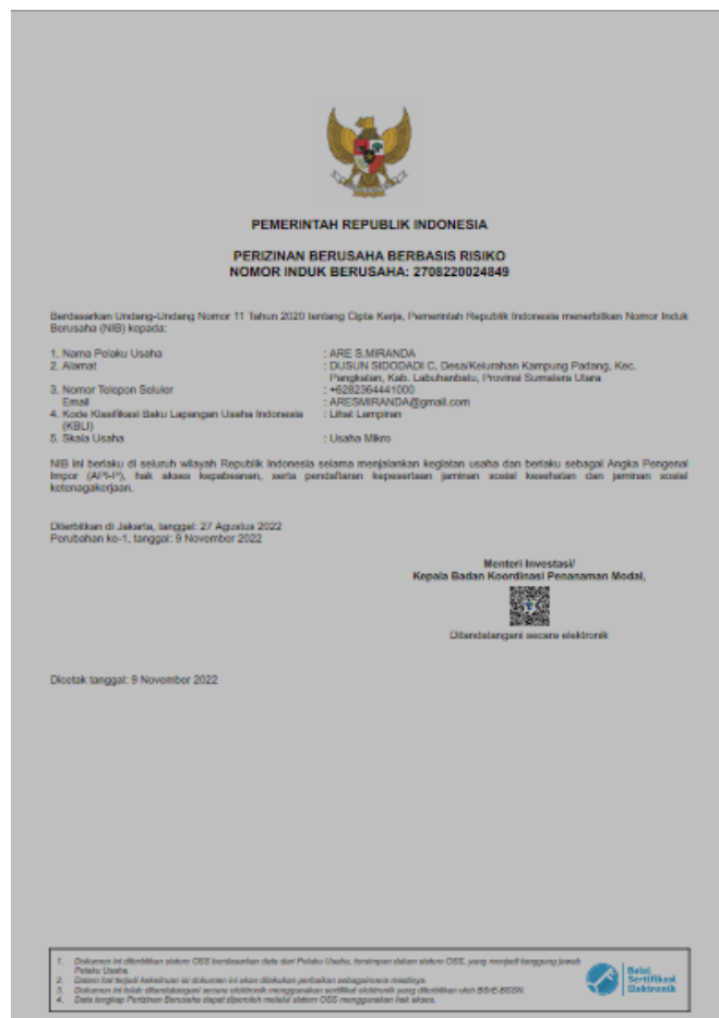
Gambar 3.3 :Surat Ijin Toko Sembako Are

Izin usaha merupakan suatu bentuk persetujuan atau pemberian izin dari pihak berwenang atas penyelenggaraan suatu kegiatan usaha oleh seorang pengusaha atau suatu perusahaan. Bagi pemerintah, pengertian usaha dagang adalah suatu alat atau sarana untuk membina, mengarahkan, mengawasi, dan menerbitkan izin2 usaha perdagangan. Agar kegiatan usaha lancar, maka setiap pengusaha wajib untuk mengurus dan memiliki izin usaha dari instansi pemerintah yang sesuai dgn bidangnya.