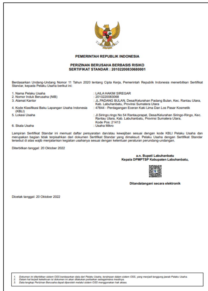
Gambar 3.7 : Surat Legalitas Laila s. Perfumery

Legalitas usaha sangat penting dalam menjalankan usaha karena memberikan kepastian hukum dan keamanan bagi pemilik usaha serta pelanggan. Legalitas usaha juga dapat meningkatkan kepercayaan konsumen terhadap usaha, sehingga dapat meningkatkan penjualan dan pangsa pasar.