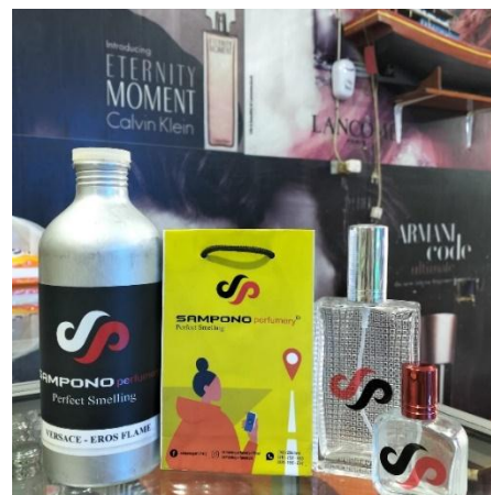
Gamabar 3.3 Bentuk promosi parfum

Pilihlah keanggunan yang sesungguhnya dengan koleksi parfum eksklusif kami. Setiap tetes parfum yang kami jual untuk memberikan pengalaman yang mengesankan, meninggalkan jejak aroma yang tak terlupakan di mana pun Anda pergi.