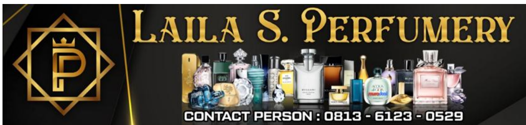
Gambar 3.2 : Logo Perusahaan Laila s. Perfumery

Logo Laila s. Perfumery memiliki filosofi sebagai berikut: