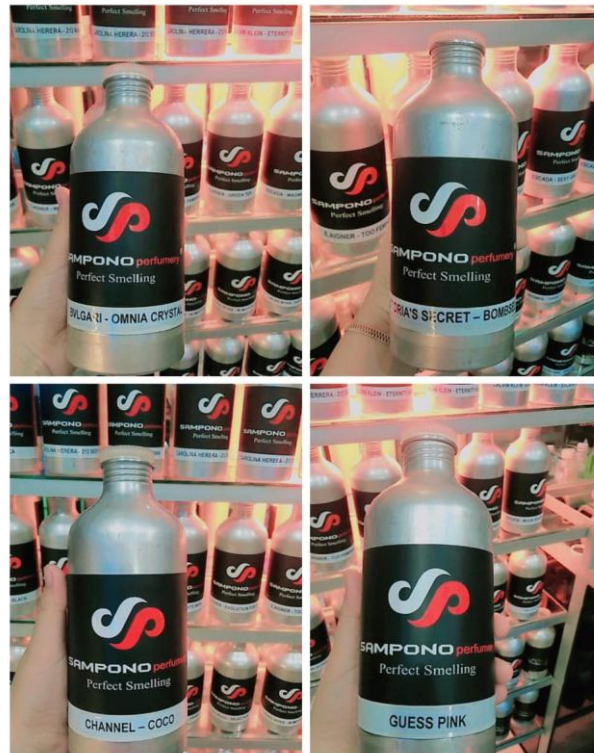
Gambar 3.6 : Produk Laila s. Perfumery