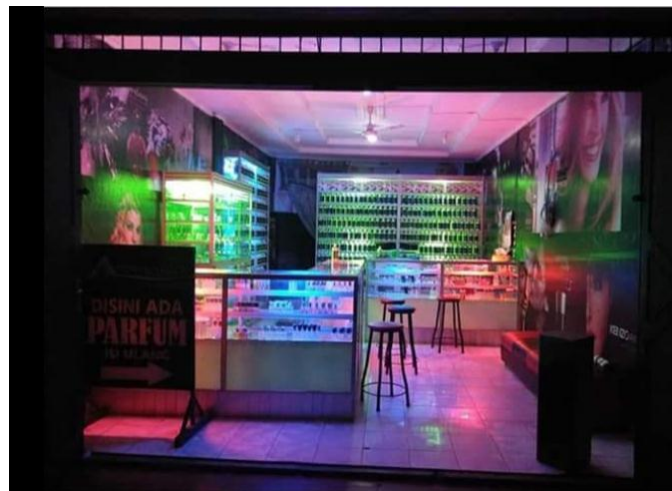
Gambar 3.1 Toko Laila s. Perfumery

Laila s. Perfumery buka setiap hari dari pukul 09.30 WIB hingga 22.00 WIB, sehingga konsumen dapat dengan mudah mengunjungi toko tersebut sesuai dengan waktu yang diinginkan. Selain itu, toko ini juga memiliki sistem pemesanan online yang memudahkan konsumen yang tinggal di luar kota untuk membeli produk-produk Laila s. Perfumery.