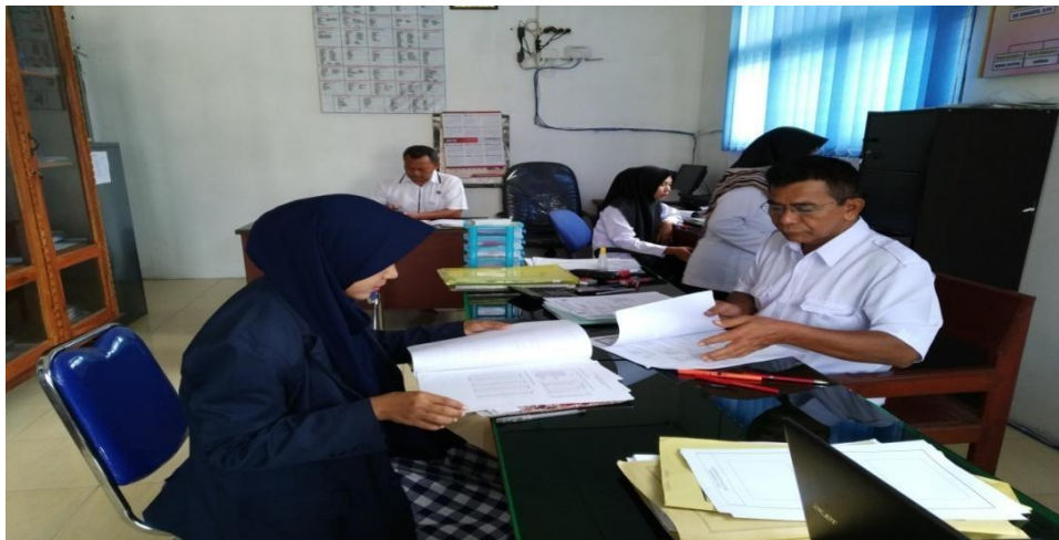
Gambar 1.2 : Meminta data dengan salah satu Kasi Pelayanan di Kantor Kepala