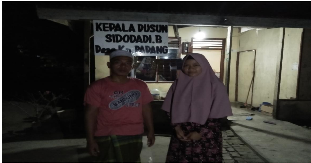
Gambar 1.5 : Foto bersama Bapak Kepala Dusun Sidodadi B