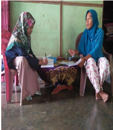
Gambar 1.9 : Wawancara kepada Ibu ID sebagai orang tua di Dusun Sidodadi B 30/04/2019