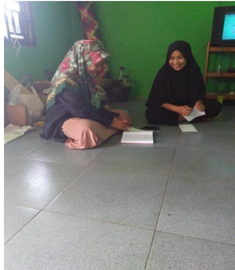
Gambar 1.10 : Wawancara kepada Ibu SB sebagai orang tua di Dusun Sidodadi B 30/04/2019