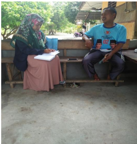
Gambar 1.11 : Wawancara kepada Bapak PO sebagai orang tua di Dusun Sidodadi B30/04/2019