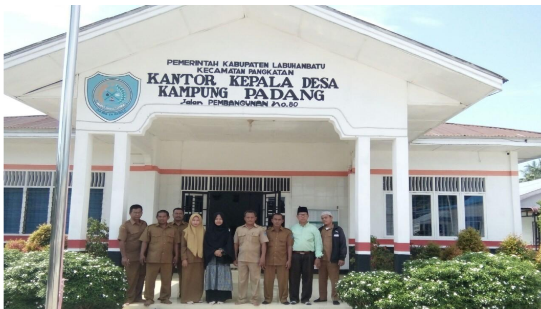
Gambar 1.3 : Penelitian di Kantor Kepala Desa Kampung Padang