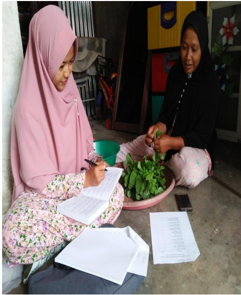
Gambar 1.3 : Wawancara kepada Ibu MSM sebagai orang tua di Dusun Sidodadi B 09/05/2019