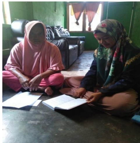
Gambar 1.12 : Wawancara kepada Ibu NK sebagai orang tua di Dusun Sidodadi B 30/04/2019