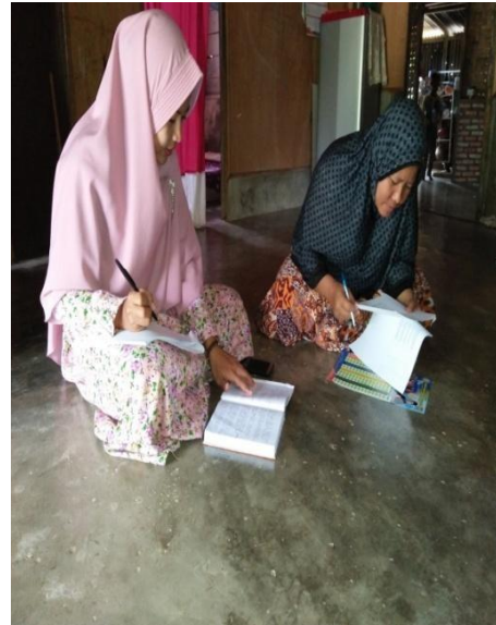
Gambar 1.14 : Wawancara kepada Ibu TM sebagai orang tua di Dusun Sidodadi B 09/05/2019