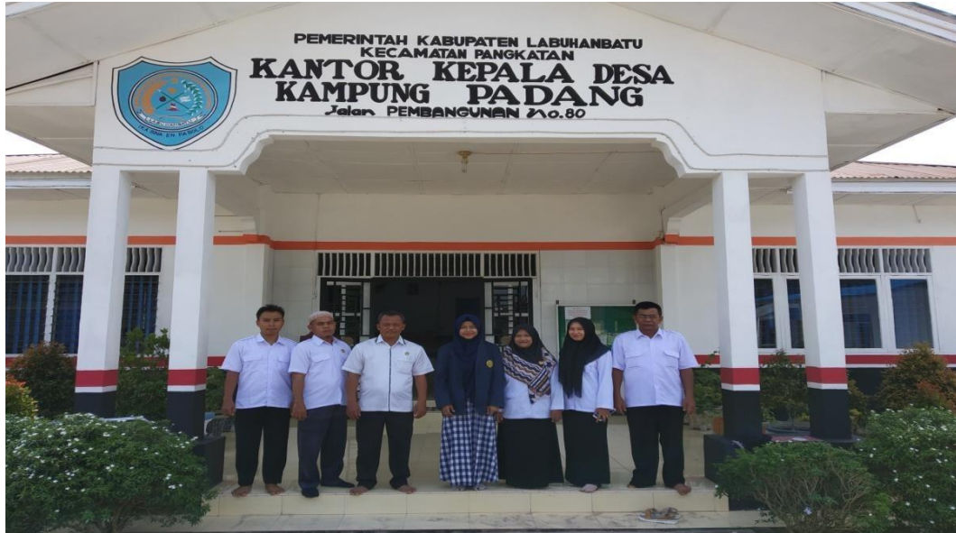
Gambar 1.1 : Observasi di Kantor Kepala Desa Kampung Padang