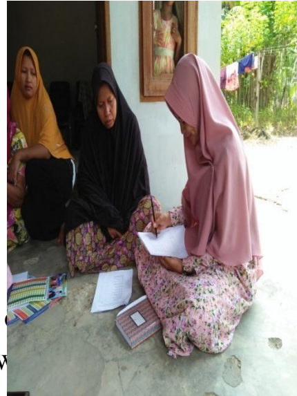
Gambar 1.15 : Wawancara kepada Ibu sebagai orang tua di Dusun Sidodadi B 09/05/2019