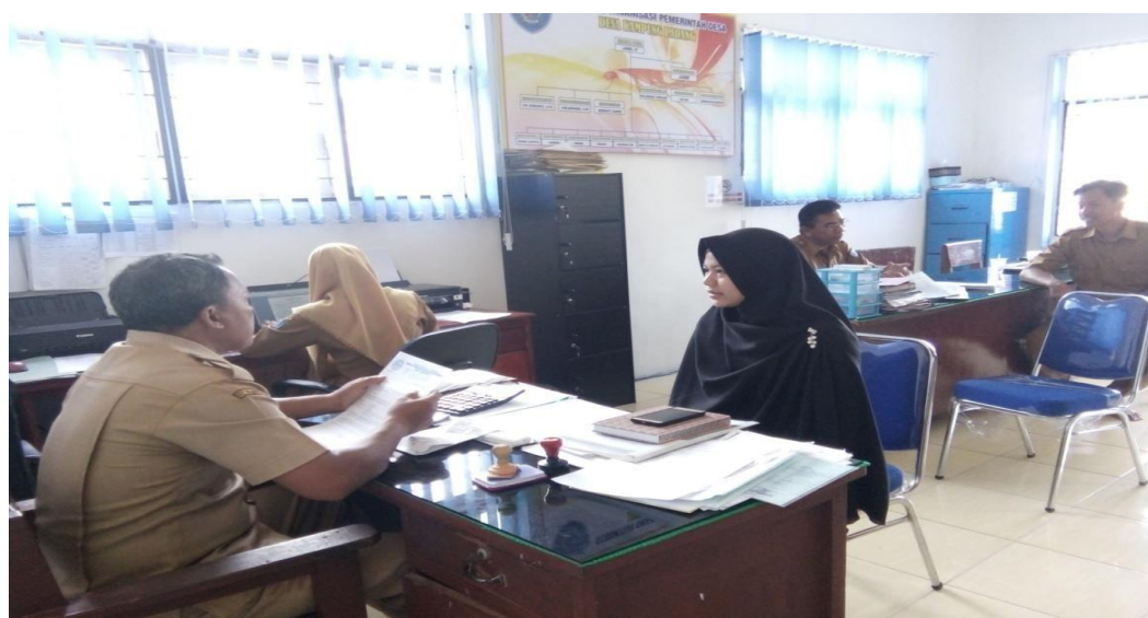
Gambar 1.4 : Wawancara kepada Bapak Sekretaris Desa (Karena Bapak Kepala

Desa tidak ada di tempat maka sebagai pengganti yang mewakili wawancara dalam penelitian ini adalah Bapak Sekretaris Desa)