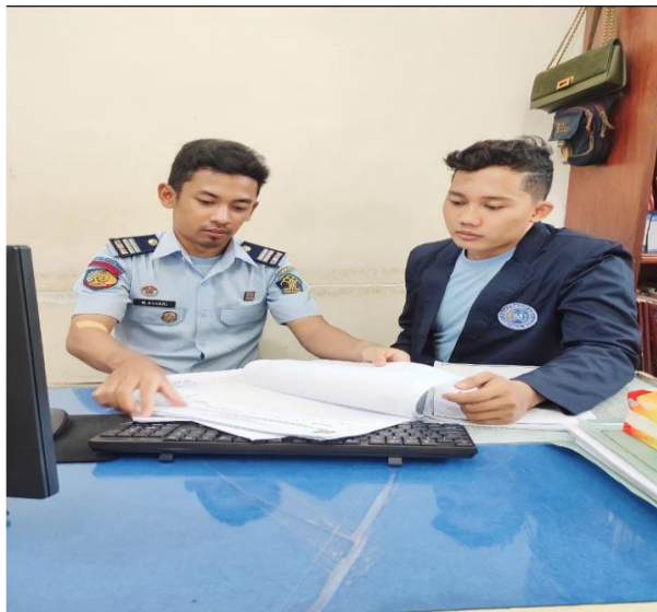
b. Pengambilan Data WBP dengan staff BIMKEMASWAT BNB