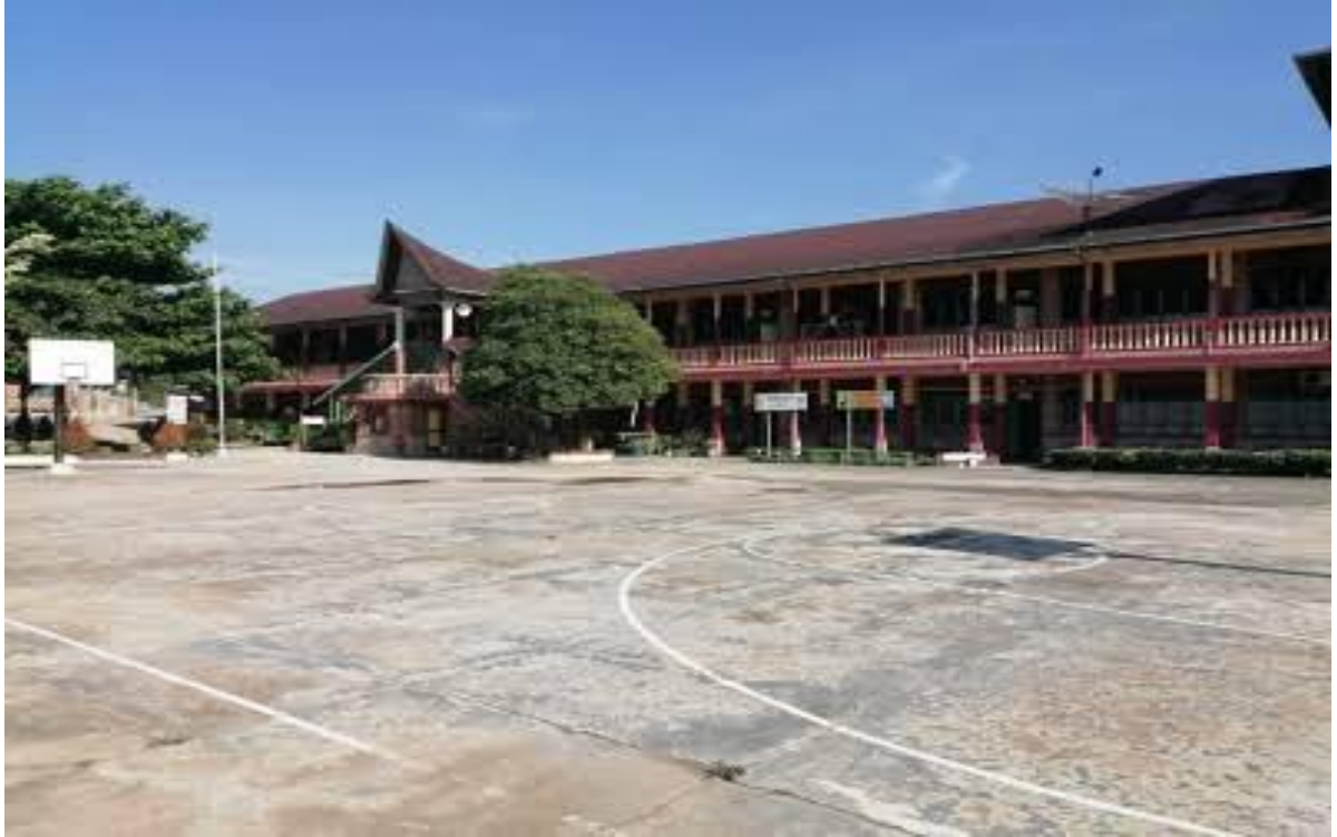
Gambar 5 : Dokumentasi Lapangan Sekolah SMA Swasta RK Bintang Timur Rantauprapat. Selasa, 07 Maret 2023