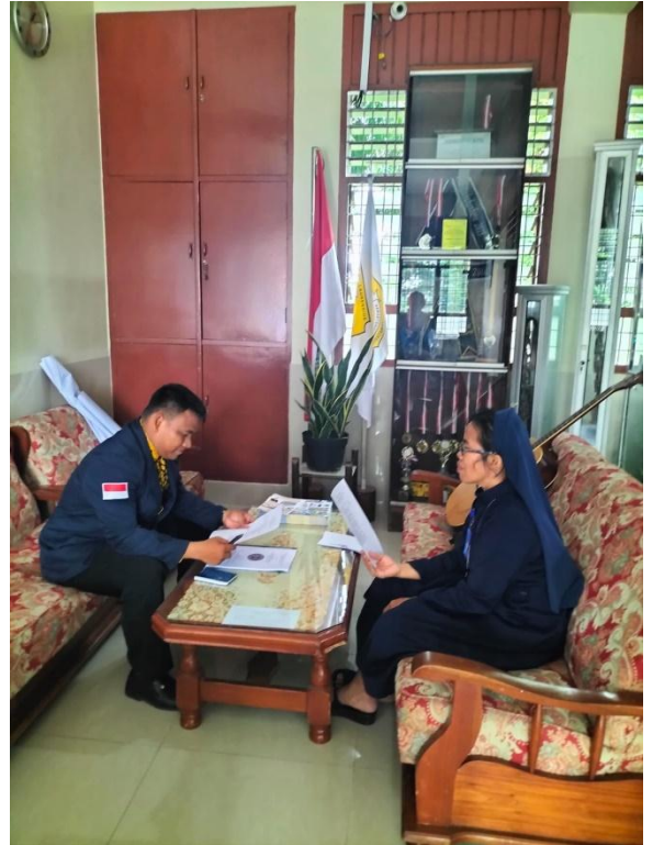
Gambar 10 : Dokumentasi Wawancara kepada Kepala Sekolah SMA Swasta RK Bintang Timur Rantauprapat. Selasa, 07 Maret 2023