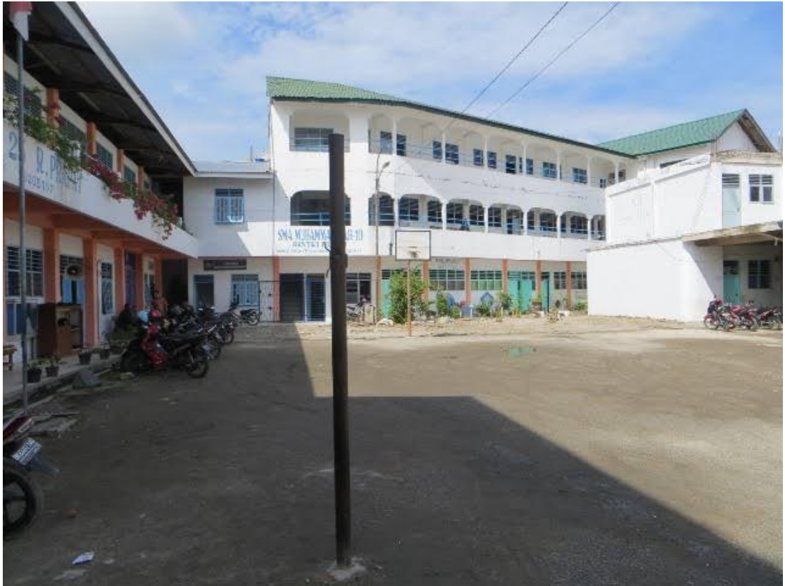
Gambar 2 : Dokumentasi Lapangan Sekolah SMA Swasta Muhammadiyah – 10 Rantauprapat. Selasa, 07 Maret 2023