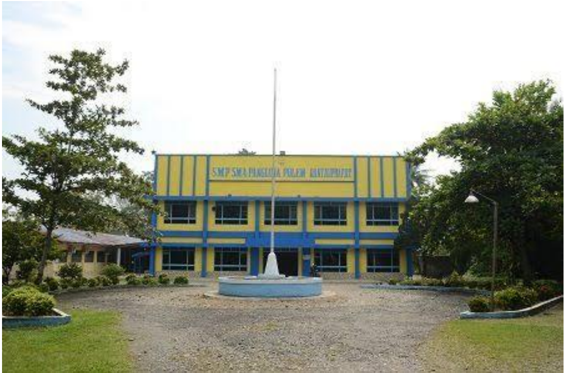
Gambar 4 : Dokumentasi Lapangan Sekolah SMA Swasta Panglima Polem Rantau Prapat. Jum'at, 10 Maret 2023