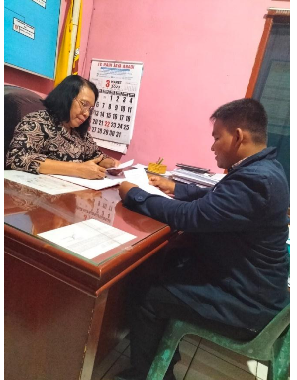
Gambar 6 : Dokumentasi Wawancara kepada Kepala Sekolah SMA Swasta Bhayangkari 2 Rantauprapat. Selasa, 07 Maret 2023