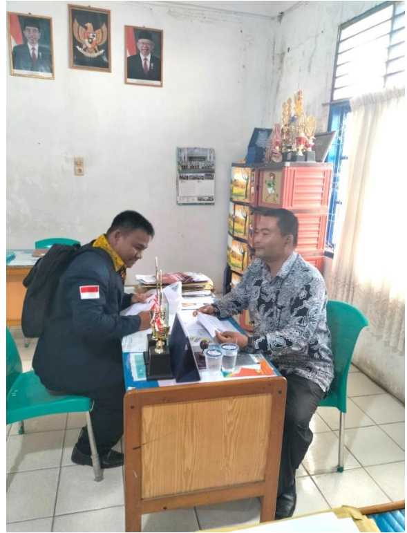
Gambar 7 : Dokumentasi Wawancara kepada Kepala Sekolah SMA Swasta Muhammadiyah -10 Rantauprapat. Selasa, 07 Maret 2023