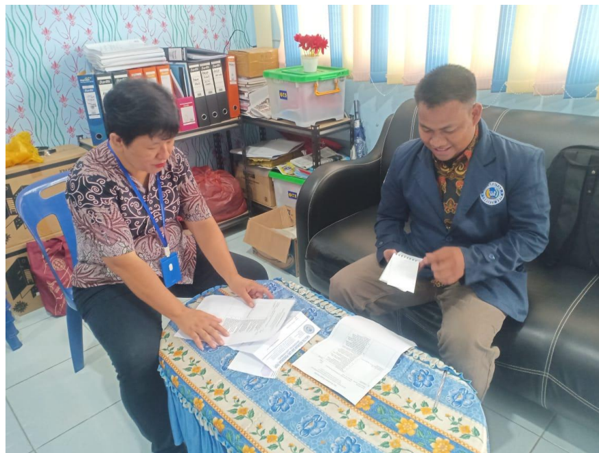
Gambar 9 : Dokumentasi Wawancara kepada Kepala Sekolah SMA Swasta Panglima Polem Rantauprapat. Jum'at, 10 Maret 2024