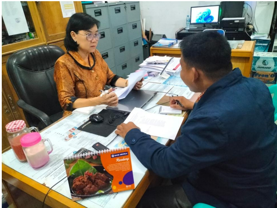
Gambar 8 : Domentasi Wawancara kepada Kepala Sekolah SMA Swasta Methodist Rantauprapat. Kamis, 09 Maret 2023