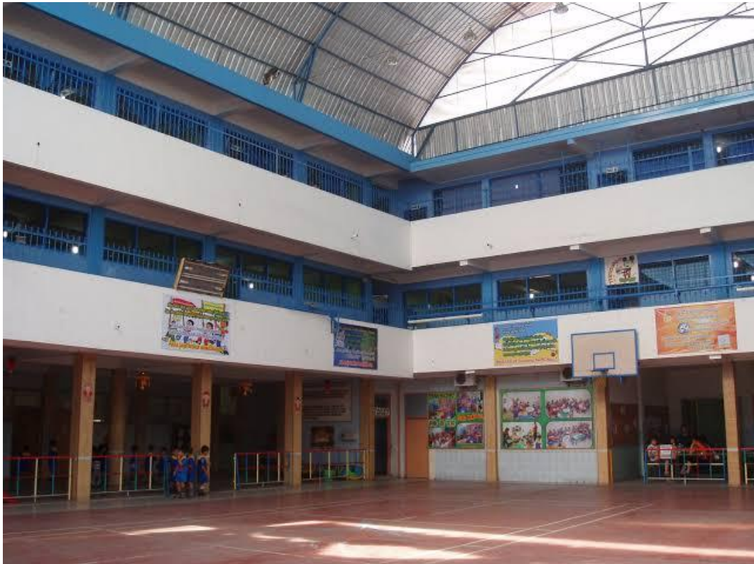
Gambar 3 : Dokumentasi Lapangan Sekolah SMA Swasta Methodist Rantauprapat. Kamis, 09 Maret 2023