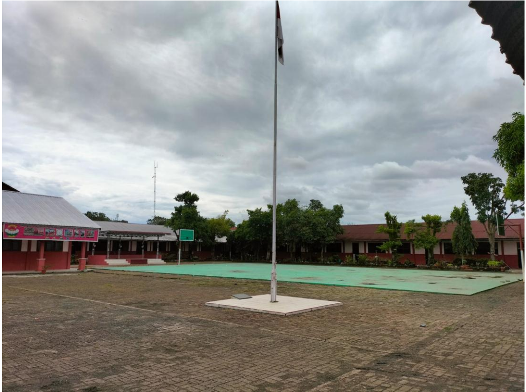
Gambar 1 : Dokumentasi Lapangan SMA Swasta Bhayangkari 2 Rantauprapat Selasa, 07 Maret 2023