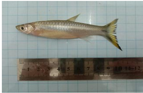
Ikan Siluang ekor kuning ( Rasbora dusonensis )