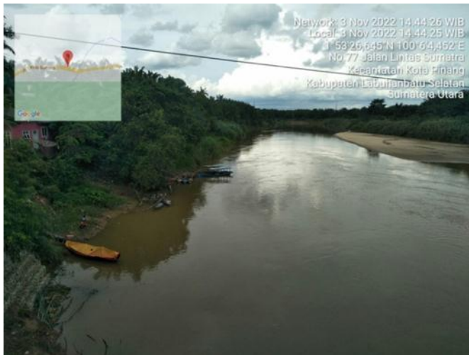
Kondisi Sungai Barumun bagian tengah Pada Stasiun 2