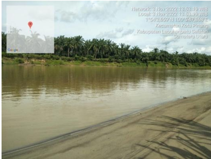
Kondisi Sungai Barumun bagian tengah Pada Stasiun 3