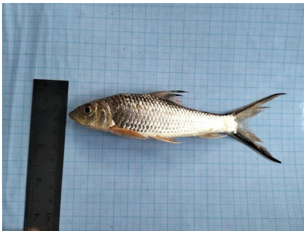
Selais ( Kryptopterus )