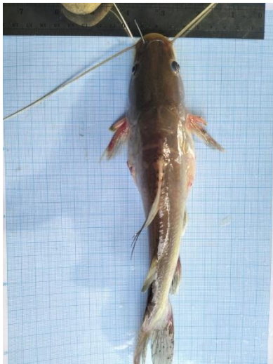
Baung ( Bagrus nemurus )