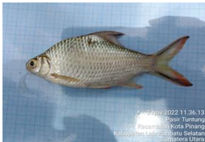
lamase ( Mystacoleucus marginatus )