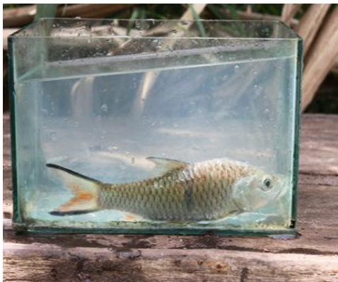
Batulu ( Barbichthys laevis )