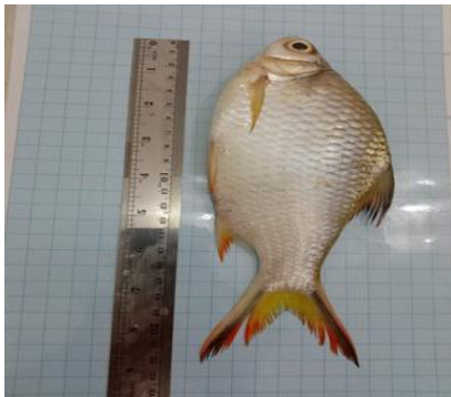
lampam ( Labeobarbus douronensis )