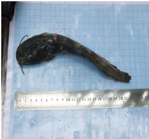
Lele ( Clariidae )