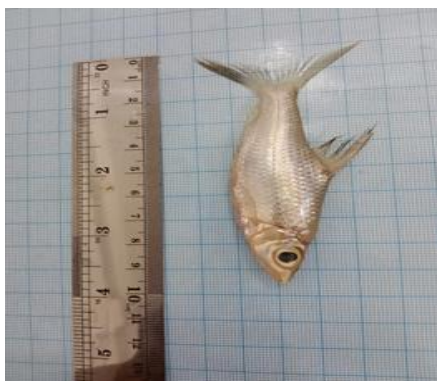
Depang-depang ( Cyclocheilichthys repasson )