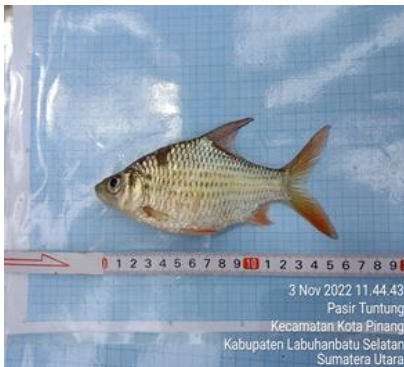
Ikan labosang ( Barbonymus schwanenfeldii )