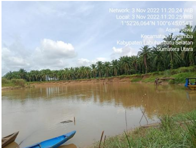
Kondisi Sungai Barumun bagian tengah Pada Stasiun 1

Lampiran 1 : titik koordinat pengambilan sampel