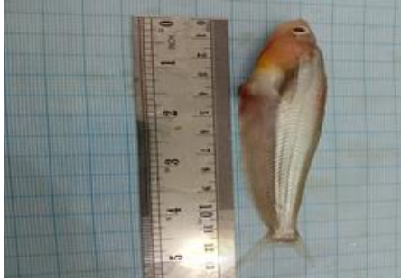
Mata merah ( Systomus rubripinnis )