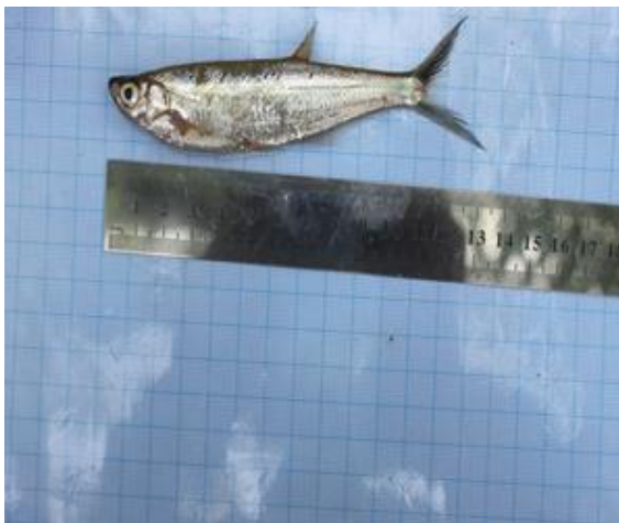
Juhar ( Oxygaster anomalura )