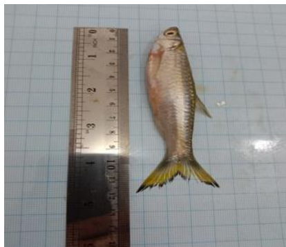
Siluang Sali pis-pis kaca ( Parachela oxygastroides )