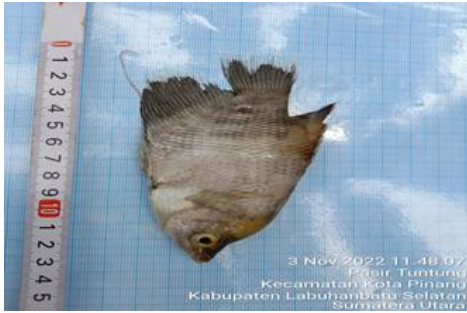
Sepat ( Tricogaster tricopterus )