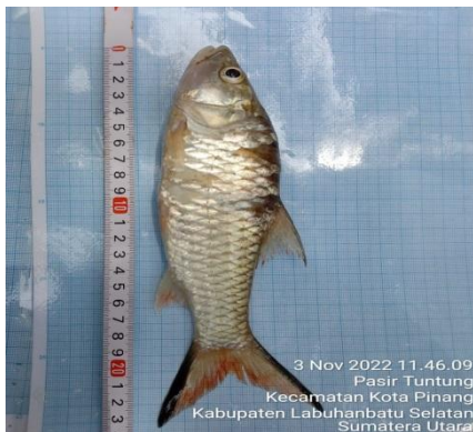
Hampa (Hampala macrolepidota)