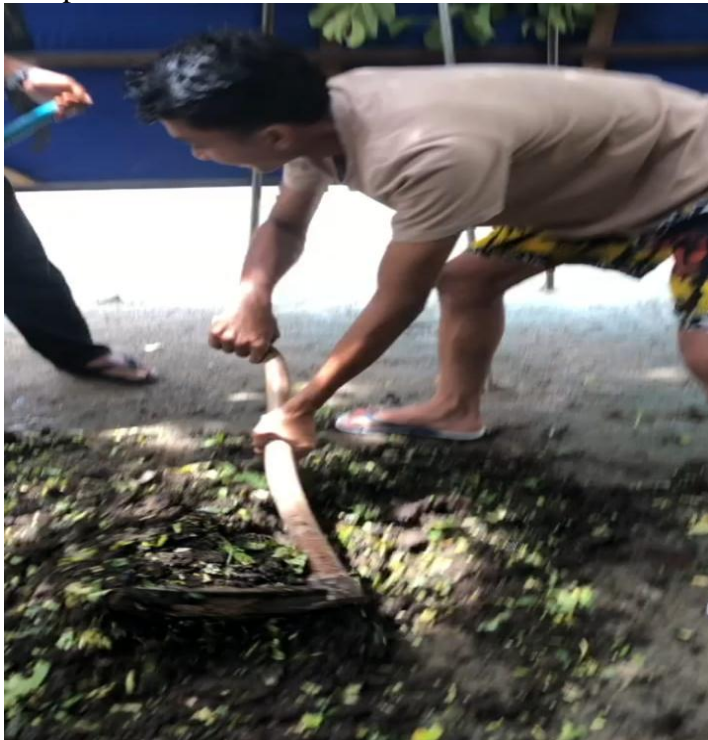
Lampiran 4. Dokumentasi.