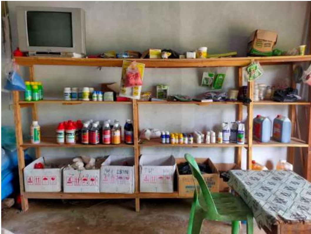
Gambar 3.6 Berbagai Jenis bibit dan racun