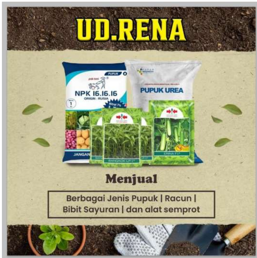
Gambar 3.1 Spanduk Toko UD. RENA