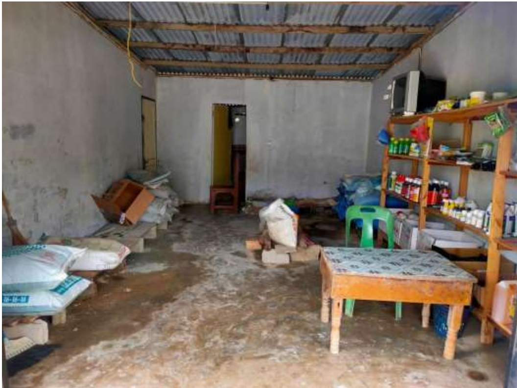
Gambar 3.5 Toko UD. RENA

Pembuatan Toko UD. RENA memakan waktu selama satu bulan lamanya, Dengan 2 orang tukang dengan gaji Rp.10.000.000 untuk 2 orang, biaya pembelian bahan Rp.20.000.000 dan biaya untuk modal awal membeli pupuk dan racun adalah Rp.25.000.000. jadi modal awal pembuatan UD. RENA Sebesar Rp.55.000.000