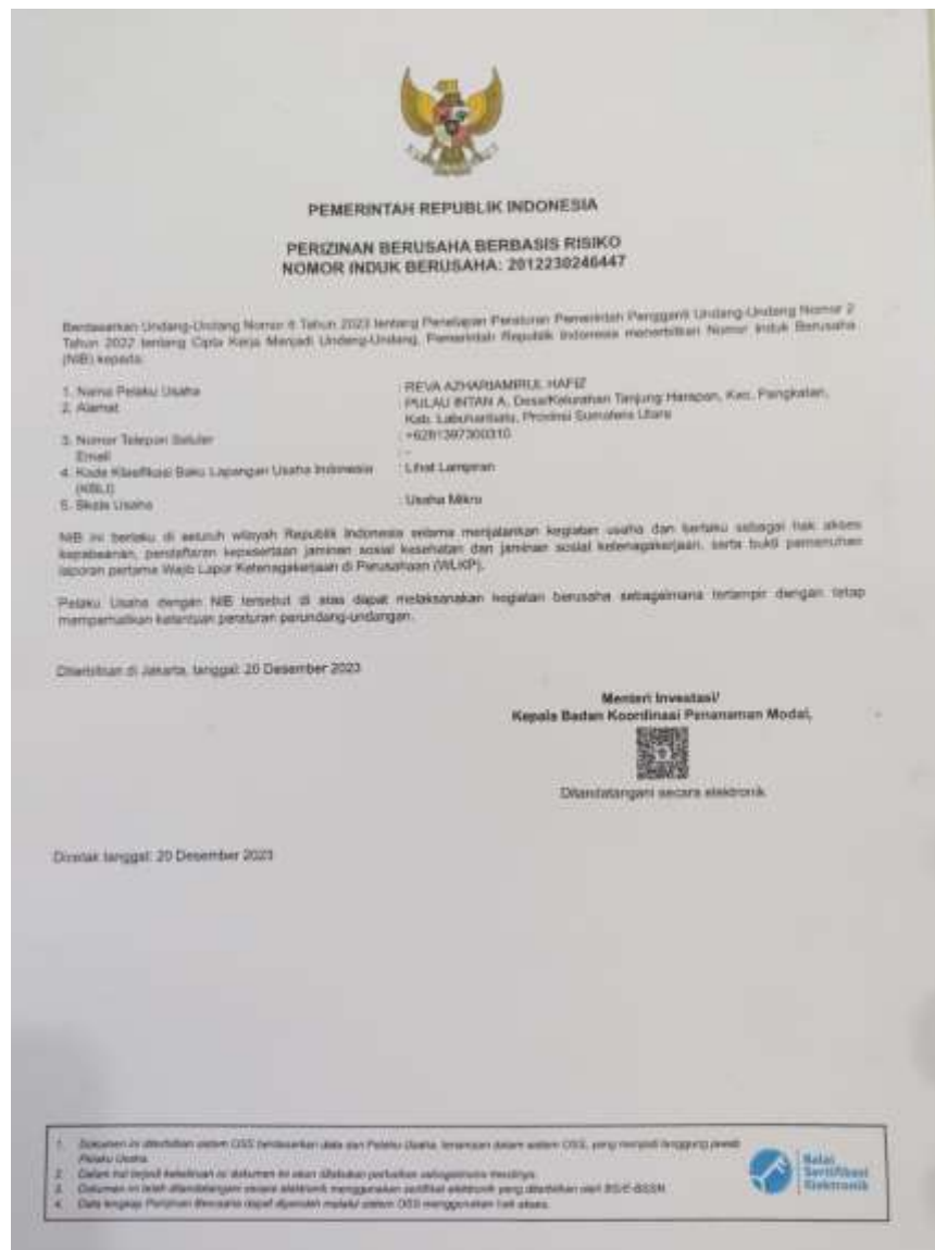
Gambar 3.3 Surat Ijin Toko UD. RENA