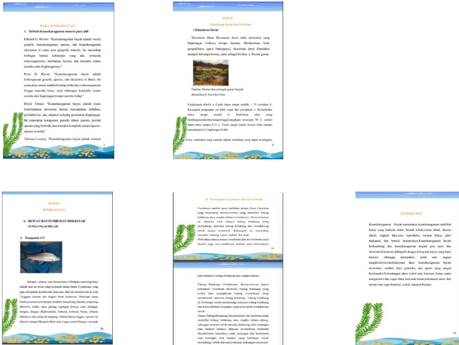
Gambar 3. Bagian Isi Buku Saku

pengertian Ekosistem Darat, pengertian ekosistem perairan, pengertian ekosistem air tawar, pembahasan tentang hewan dan tumbuhan di sekitar sungai bilah, perbedaan hewan vertebrata dan invertebrata, rangkuman dan latihan soal. Materi disajikan dengan ilustrasi yang sesuai, sehingga diharapkan dapat menambah pemahaman mahasiswa