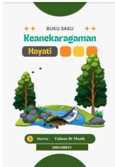
Gambar 1 Cover buku saku

menggunakan corel draw X7 dengan desain perpaduan warna hijau, kuning, orange, biru, coklat, abu abu, dan putih. Jenis font yang digunakan gosmick sans .